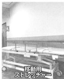
移動用 ストレッチャー