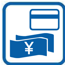
お金に関すること